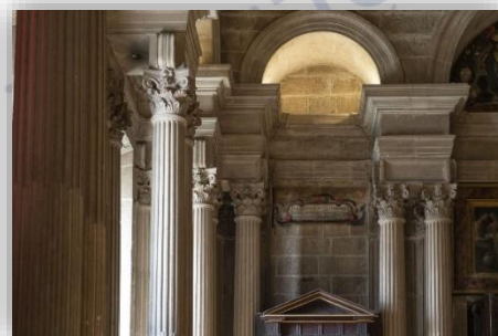
Bóveda y arcadas de la sacristía de la Catedral. Dependencias del Cabildo